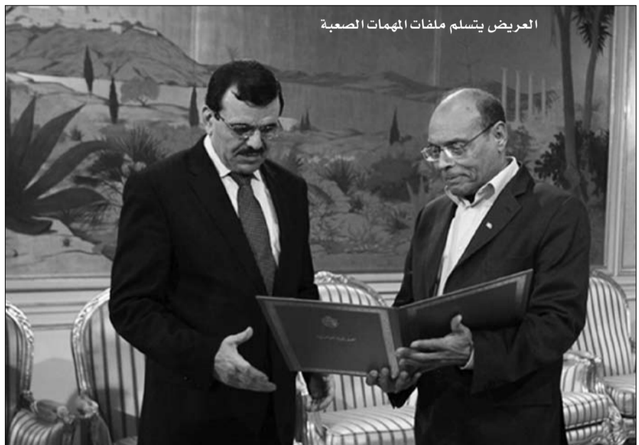
العريض يتسلم ملفات المهمات الصعبة

صخرة قد يكون لتدريجها هذه المرة وقع الزلزال. ويبقى السؤال، هل أن علي العريض الذي جاءت به الأحداث لرئاسة الحكومة سيثبت قدرته على صناعة الأحداث والفعل فيها، أم انه سيبقى سجين المعادلة التي ارتقت به من وزير للداخلية إلى رئيس للوزراء، وهي معادلة حسب المراقبين لن تخرج تونس من أزمتها بل قد تزيد في تعميها.