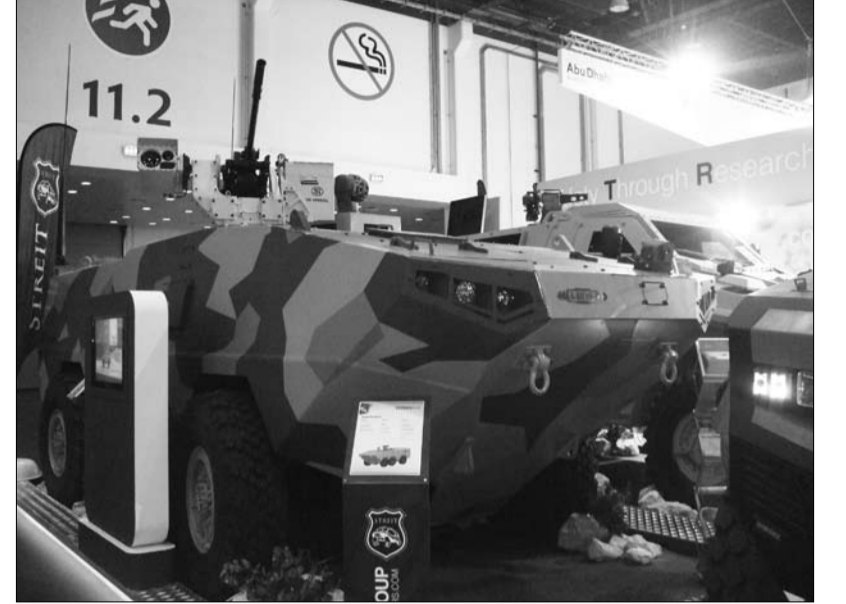
أسدل الستار على أيدكس بعد مرور 20 عاماً من الإنجازات