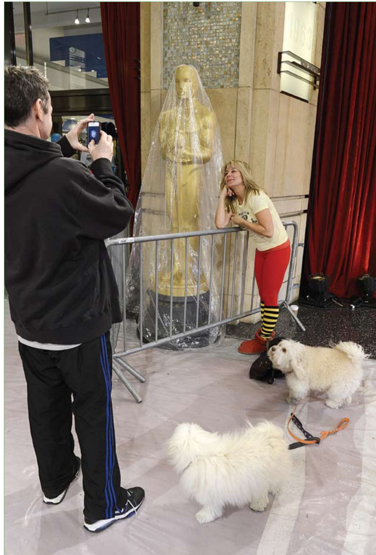
سائح يلتقط صورة لزوجته بجوار تمثال أوسكار حيث تجري الاستعدادات لتوزيع جوائز الأوسكار في هوليوود اليوم الأحد.

ومن اللافت أن 12 من أصل 15 نجمة نلن جائزة أفضل ممثلة، يكن خلال تسلم جوائزهن.